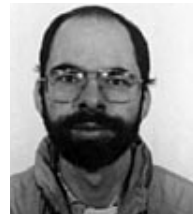
Institut für Konstruktion und Bauweisen der ETH Zürich