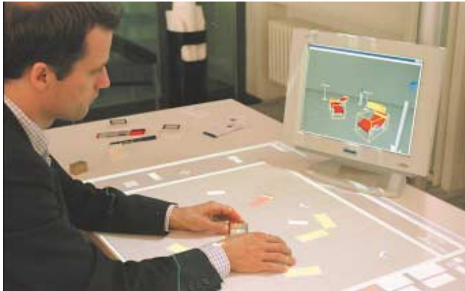
2 Einzelarbeitsplatz mit kleiner Seitenansicht.

Im Gegensatz zum klassischen Vorgehen strebt das System «BUILD-IT» eine möglichst vollständige Lösungsfindung am Besprechungstisch an, wobei alle relevanten menschlichen Know-how-Träger in die Diskussion einbezogen und bei der Lösungsfindung durch 3D-Darstellung, Simulation und Animation unterstützt werden. Der Schlüssel dazu ist eine neu-