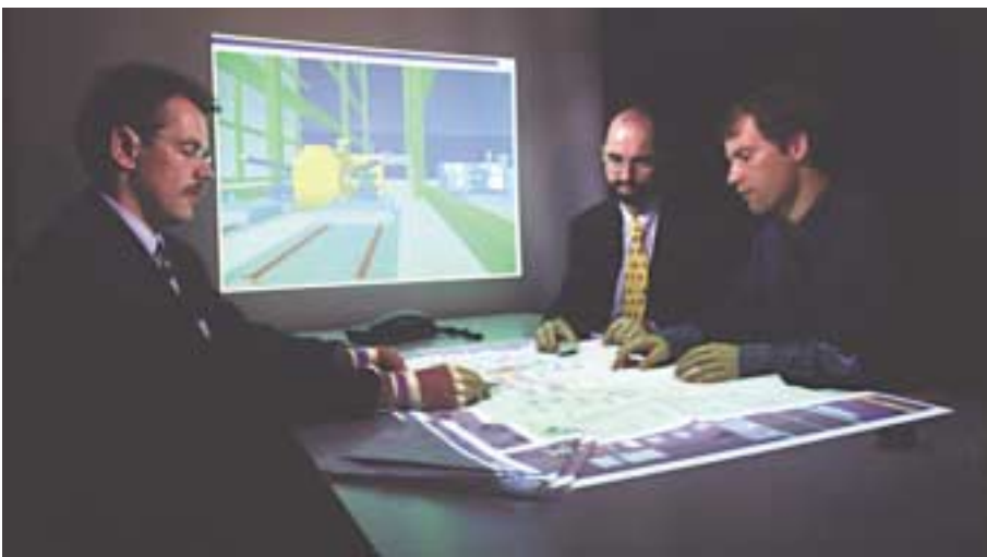
1 Gruppenarbeitsplatz für kollaborative Planungsprozesse.

Sie sitzen zusammen mit anderen Experten am Besprechungstisch – Kaffeetasse und Aktenmappe vor sich. Auf der Tischfläche sehen Sie zusätzlich ein projiziertes Bild der Anlage, die Sie gerade planen. Die virtuellen Planungsobjekte bewegen Sie, indem Sie ein Klötzchen daraufstellen und mit diesem die Objekte verschieben und drehen. Das vorgestellte System eignet sich nicht nur für Anlagenplanung, sondern auch für die Planung von Produktionsanlagen, Wohnungseinrichtungen, Stadtteilen und anderem mehr.